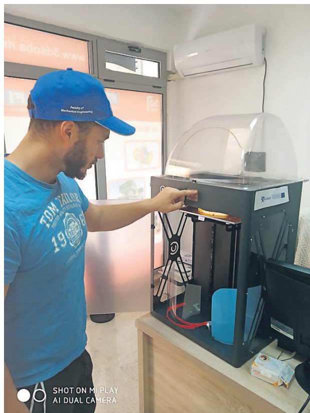
SHOT ON MI PLAY AI DUAL CAMERA

"Naš cilj, kao društveno odgovornog subjekta, jeste da u ovom trenutku pomognemo najizloženijima i najbitnijima u borbi protiv virusa COVID-19, a to je